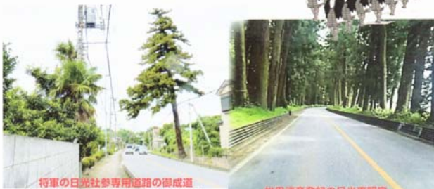
将軍の日光社参専用道路の御成道

江戸時代将軍の日光社参専用道路であったが、唯一岩槻藩だけが参勤交代の時に使用を許された由緒ある道路です。