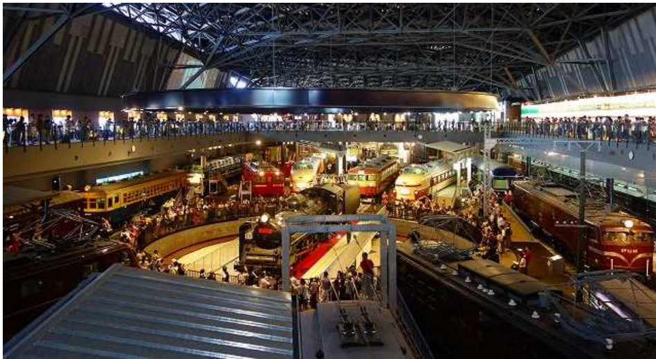
写真は補助金事業の養護施設いわつきの子供達との鉄道博物館見学(上・下)