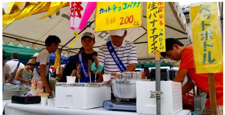
岩槻まつりの「流しそうめん」と「ポップコーン・チョコバナナ・その他販売の屋台」風景