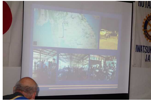
パワーポイントにて、報告して頂きました。