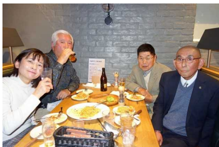
初めての岩槻駅西口ヤオコー入り口角の「グリルダイニング V」にての、理事会となりました。料理はイタリアン系ですが、ちょっと変わっていて、たまには良いのかなあ～。小宮年度、第13回理事会懇親会風景です。