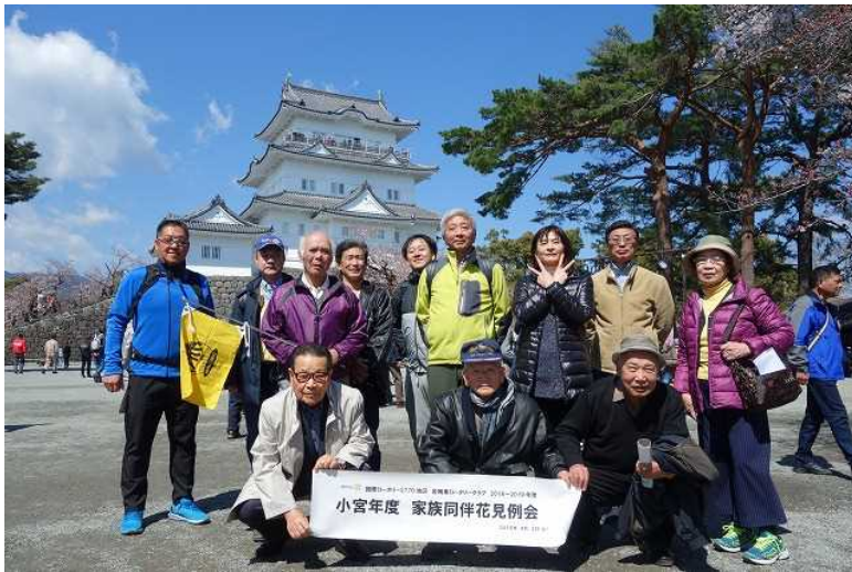
4月2日、小田原にて花見例会を行いました。写真下は白秋資料館