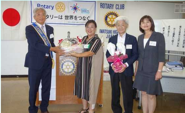
今月、誕生月・結婚月の皆様、お目出とうございます。これからもお元気で……。