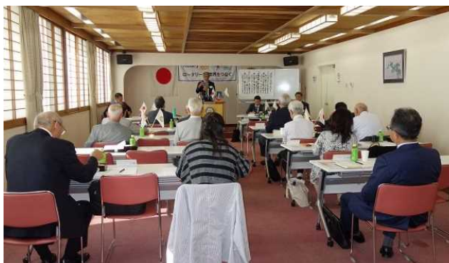
写真は久々の401号室での例会風景、この後、遅れて出席された会員も若干おりましたが、やや少ない例会です。