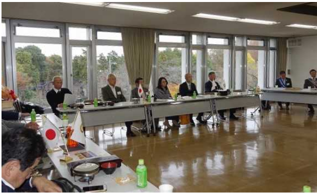
久々の定例会場にての例会風景です。