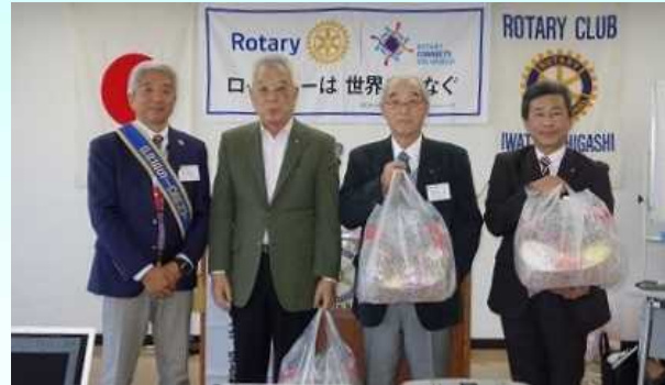
今月、誕生月・結婚月の皆様、お目出とうございます。これからもお元気で……。