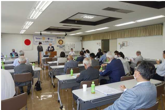
新型コロナウイルスの感染予防の為に、1テーブルに2人づつに着席して、例会を行いました。