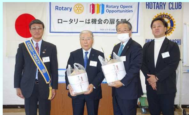
今月、結婚月・誕生月の皆様、お目出とうございます。結婚祝いには「林檎」をご自宅へお送り致しました。。