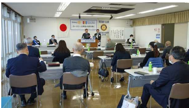
出席会員数が三分の一以上になり、年次総会が成立しました。

私が楽しく行動する事で後に続く会長、そして新しい会員が増えて行く事に繋がると信じて、力一杯勤めて参りますので、どうぞ皆様、宜しくお願い致します。