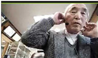
阿津澤清クラブ管理 運営担当理事