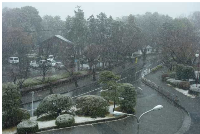
今年初めての雪景色です。岩槻市民会館3階の定例会場よりの、風景です。

以上、ベトナムのテトをご紹介させていただきました。ご静聴ありがとうございました。