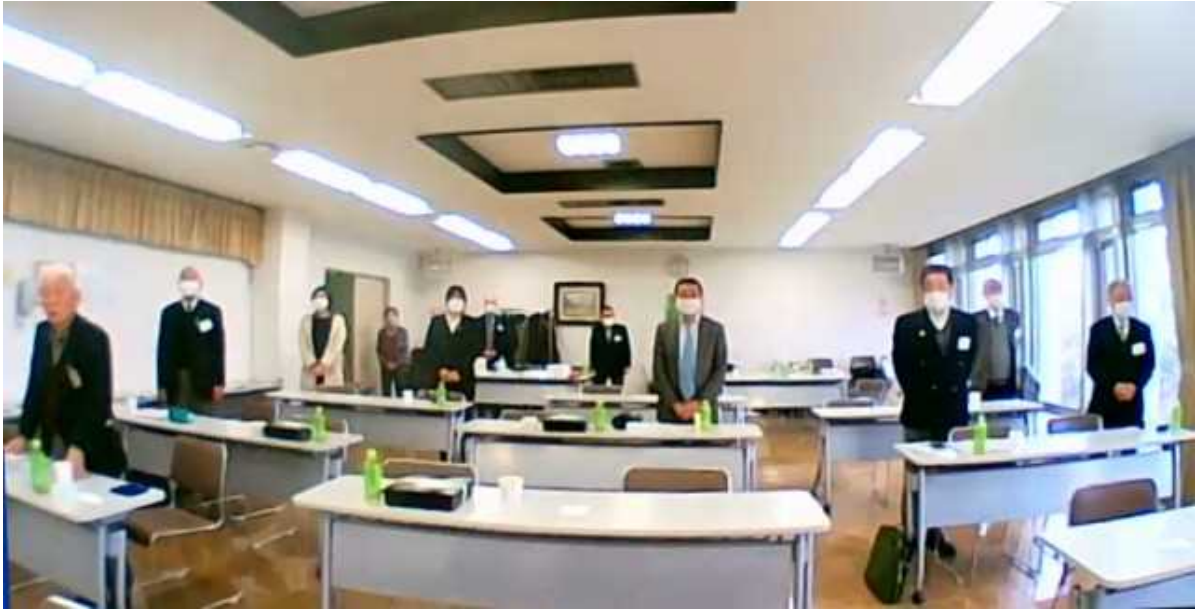
ハイブリッド例会、前からの会員達の様子です。