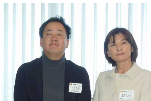
写真は、次年度会長・幹事