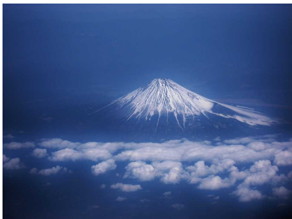
冬の景色・富士山