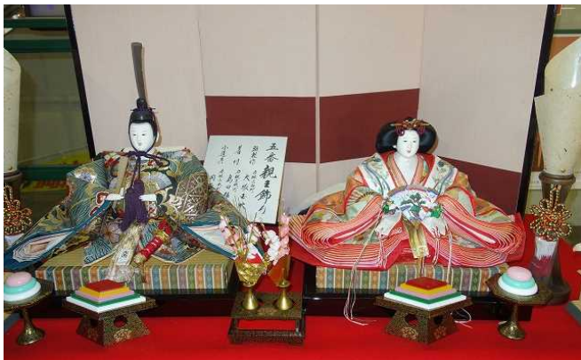
ワッツ東館にお雛様が飾られておりました。