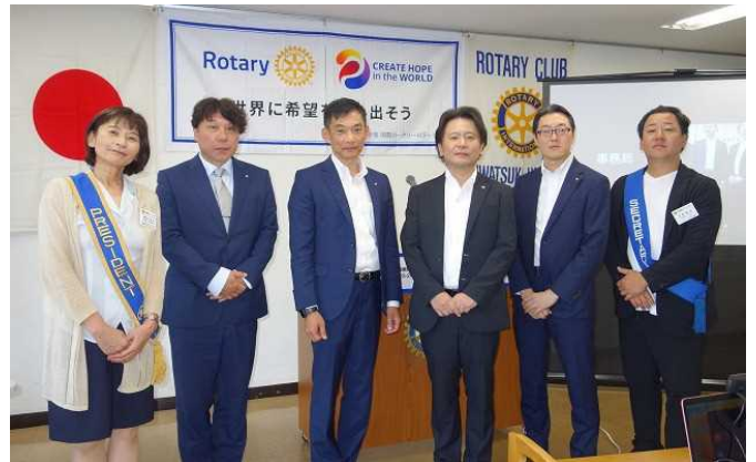
橋本会長、京野幹事、お客様の大宮西RCと大宮東RCの会長・幹事と一緒に記念撮影です。