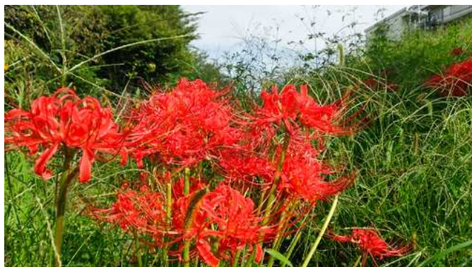
今年は、猛暑の夏でしたが、ようやく彼岸花の咲く季節となりました。涼しさが恋しい季節です。