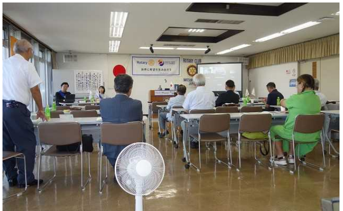
クラブフォーラム例会風景