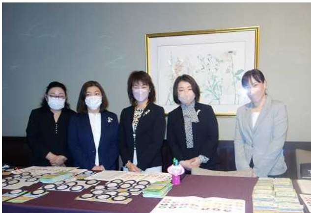
受付の第4グループ各ロータリークラブ事務局様