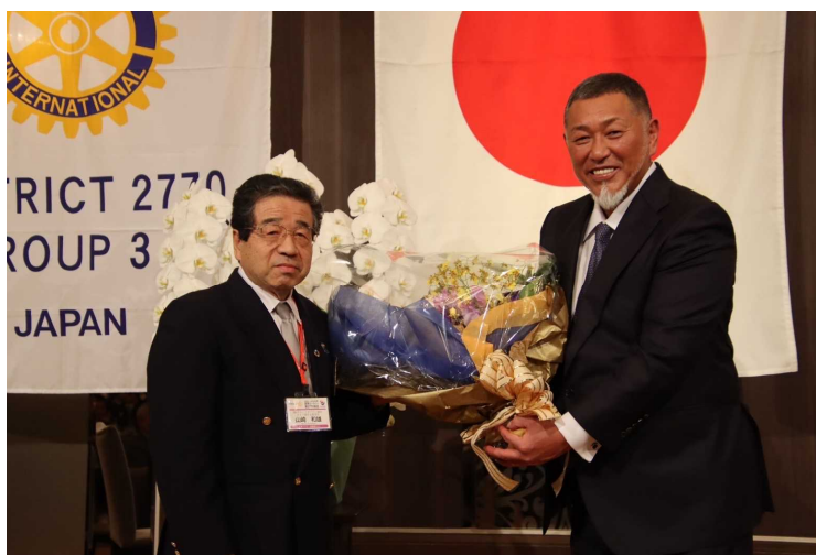
清原和博様の録音・写真等は当初は規定により、掲載を禁止されておりましたが、後から週報への掲載のみ承諾が得られましたので、載せさせて頂きました。